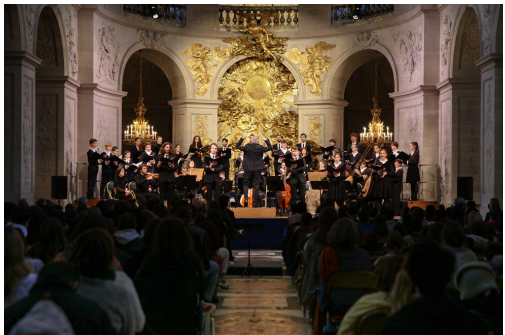
La Maîtrise du Centre de musique baroque de Versailles

Ce partenariat inédit et ô combien novateur fera entendre, en regard de ces créations, des pièces baroques françaises des XVII e et XVIII e siècles, comme par un jeu de miroir entre histoire et création, passé et avenir.