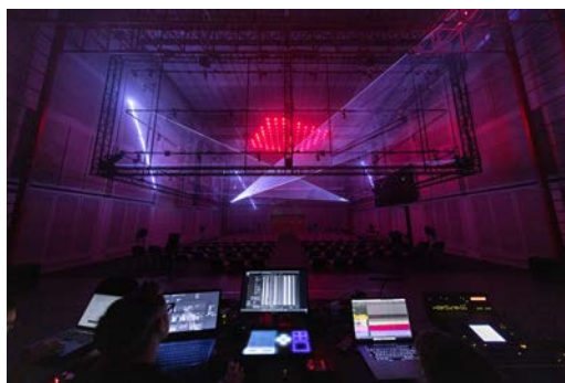
L'Espace de projection de l'Ircam

Les concerts à l'Espace de projection de l'Ircam se feront dans l'acoustique reconstituée de la Chapelle royale du château de Versailles, grâce à un système d'empreinte acoustique mis au point par les chercheurs de l'Ircam.